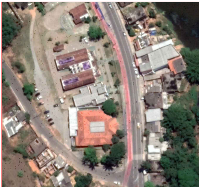
LOCALIZAÇÃO ESCALA: 1/500