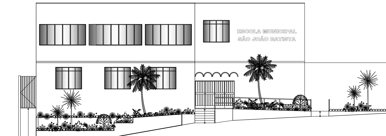
FACHADA PRINCIPAL S/ ESCALA